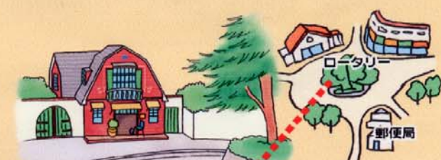
映画で「地球屋」 があったロータリー ※実際「地球屋」はありません。